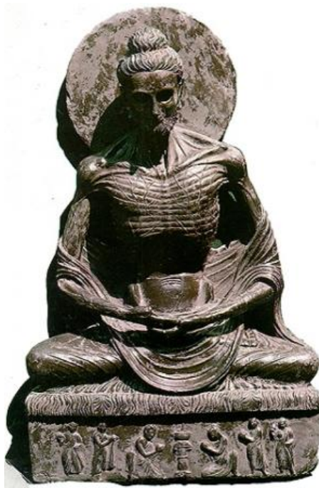
Будда в пещере Дунгешвари

Посещение храма Махабодхи. Первый храм на этом месте был построен во II в.д.н.э. Удивительно, но в храме сохранилось несколько статуй, созданных в это время. Современный Храм Махабодхи построен в VI веке, но с того времени неоднократно перестраивался. Храм также считается священным для индуистов, поскольку Будда для них – это девятая реинкарнация бога Вишну. Храм Махабодхи внесен в список всемирного наследия ЮНЕСКО.