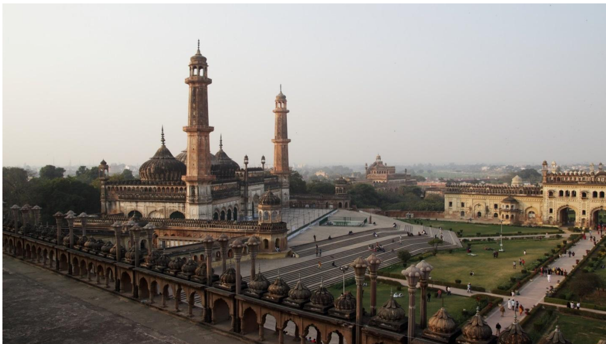
На фото: Лакхнау

«Однажды Блаженный пребывал в Саваттхи, в роще Джеты, в обители, подаренной [общине] Анатхапиндикой. И в то самое время в области, подвластной царю Пассенади Косальскому, жил разбойник по прозвищу Ангулимала-кровапроливец лютый, в смертоубийствах закоснелый, душегуб безжалостный...» (Ангулимала сутта)